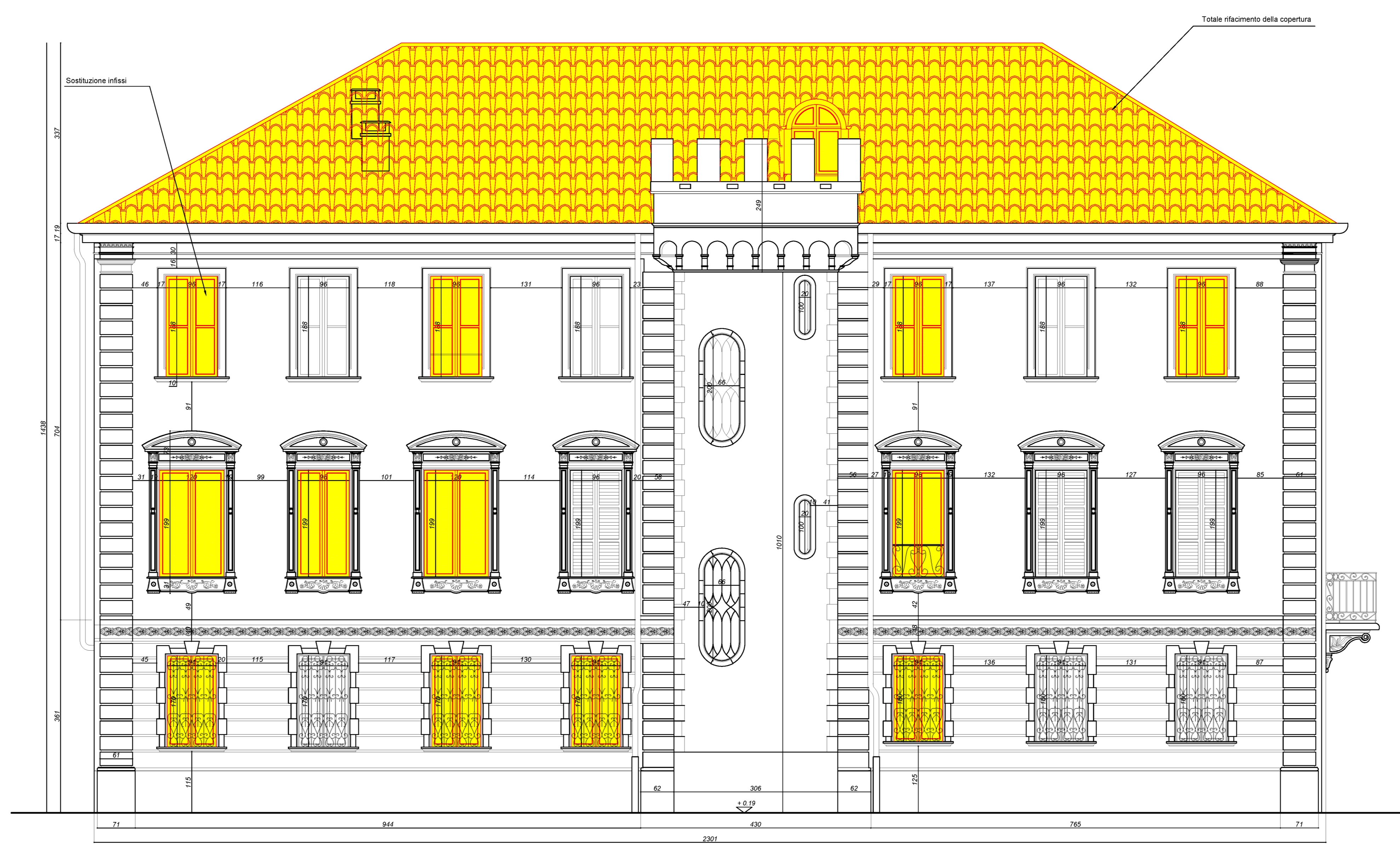
04 PROSPETTO NORD-EST SCALA 1:50